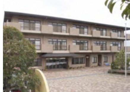
船橋エリア (朋松苑) 047-410-0117 (最寄駅) 海神 駅 または 東海神駅