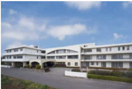
八千代エリア (美香苑) 047-482-8670 (最寄駅) 勝田台 駅からバス15分