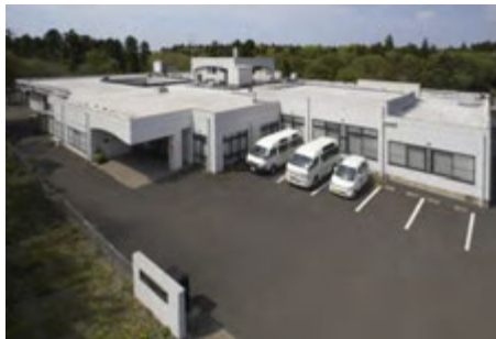
千葉エリア (ちば美香苑) 043-228-3848 (最寄駅) 鎌取 駅から送迎有り